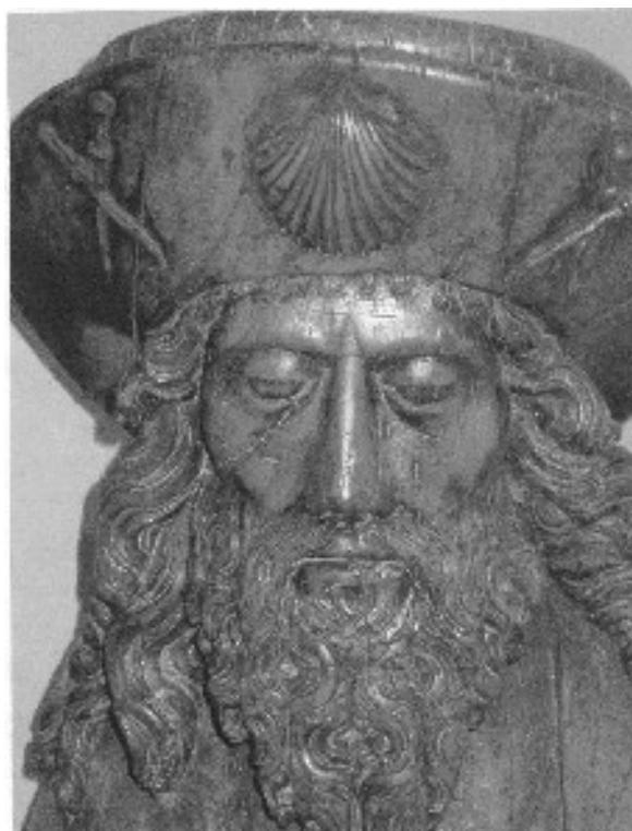
Saint Jacques - statue en bois de la fin du XV e siècle -

Ces rencontres sont toujours très riches. Elles nous montrent que toutes les associations ont des problèmes identiques, mais que les solutions sont parfois très différentes, certaines bien meilleures que d'autres. Les relations nouées avec les responsables permettent d'envisager de magnifiques sorties pour les mois à venir !