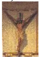
Tympan d l'église d'Armentia

Ces deux signes, opposés par le sommet, forment la base de la construction de l'étoile à 6 branches qui deviendra le chrisme représenté sur tant d'églises !