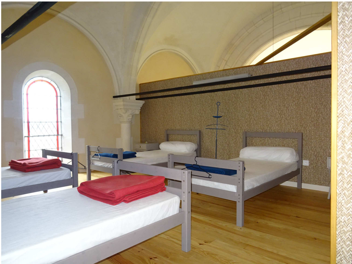
Chambre à l'étage.