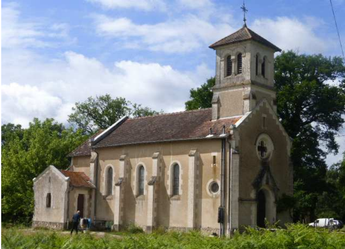
La petite église Saint Loup de Vialotte