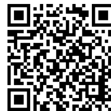
Tracé de la voie

Le choix de ce parcours vous permettra de découvrir la belle et réputée région viticole du Médoc, et d'aborder la banlieue bordelaise par une coulée verte.