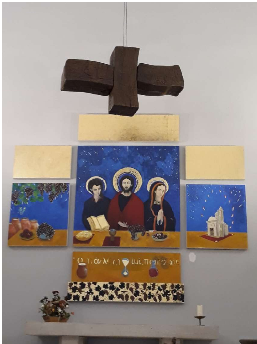
Le retable de l'Abondance et la colombe eucharistique.

Ne restez pas dans les regrets. Prenez le temps d'entrer vous aussi dans ce site, d'ouvrir tranquillement les onglets et sous-onglets. Un jour vous aurez envie d'aller découvrir Saint-Rémi de la Vigne, lors d'un office, d'une heure de silence, d'un concert... ou juste pour y être et rencontrer son curé exceptionnel.