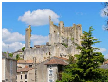
Un des châteaux de Chauvigny

Samedi 24 juin , le rendez-vous est fixé, à 6 h45 sur le parking Monichon au Bouscat pour un départ impératif du bus à 7h.