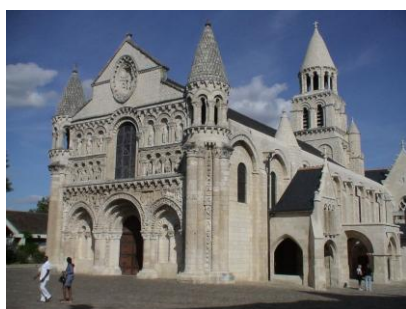
Notre-Dame la Grande

Le petit déjeuner sera possible à partir de 7 h 30, pour, après dépose des bagages dans le bus, un départ à 9 h et à pied vers le centre de Poitiers ( compter 3,5 km, il n'y pas de bus de transport en commun le dimanche mais possibilité de taxis pour ceux qui le désireraient )