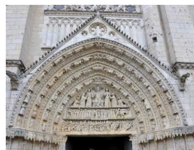
Portail de l'église Saint-Pierre

Puis à 14 h 30, poursuite de la visite guidée: cathédrale Saint-Pierre, de son mobilier et ses fresques; baptistère Saint-Jean, un des plus anciens monuments chrétiens d'Europe; église Sainte-Radegonde et quartier épiscopal